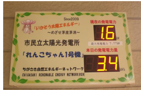
茅ヶ崎市民立太陽光発電所の発電表示装置 川崎市国際交流センターの市民おひさま太陽光発電所