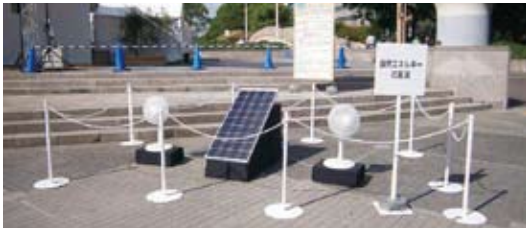
太陽光発電の実演

太陽光発電についてのパネル展示、ソーラーパネル実演展示、ソーラーカーレース、ソーラー噴水、ミニソーラーハウスなど参加体験コーナーが盛り沢山。