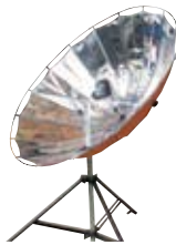
ソーラークッカー