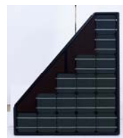
オプション設置したイメージ