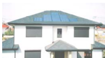
設置プランイメージ